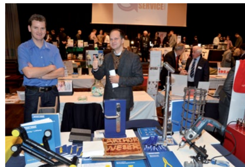
Arthur Weber AG, Stahlhandel, Haustechnik, Handwerkerzentrum, Sicherheitstechnik, Seewen.