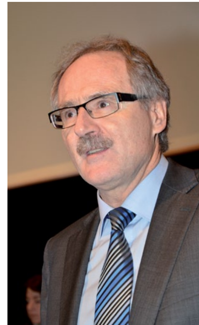
Regierungsrat Kurt Zibung bei der Eröffnungsansprache.