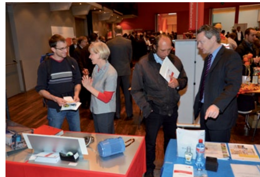
Adolf Marty Elektromechanik Antriebstechnik, Brunnen und HR Hunold, Personaldienstleistungen, Lachen.