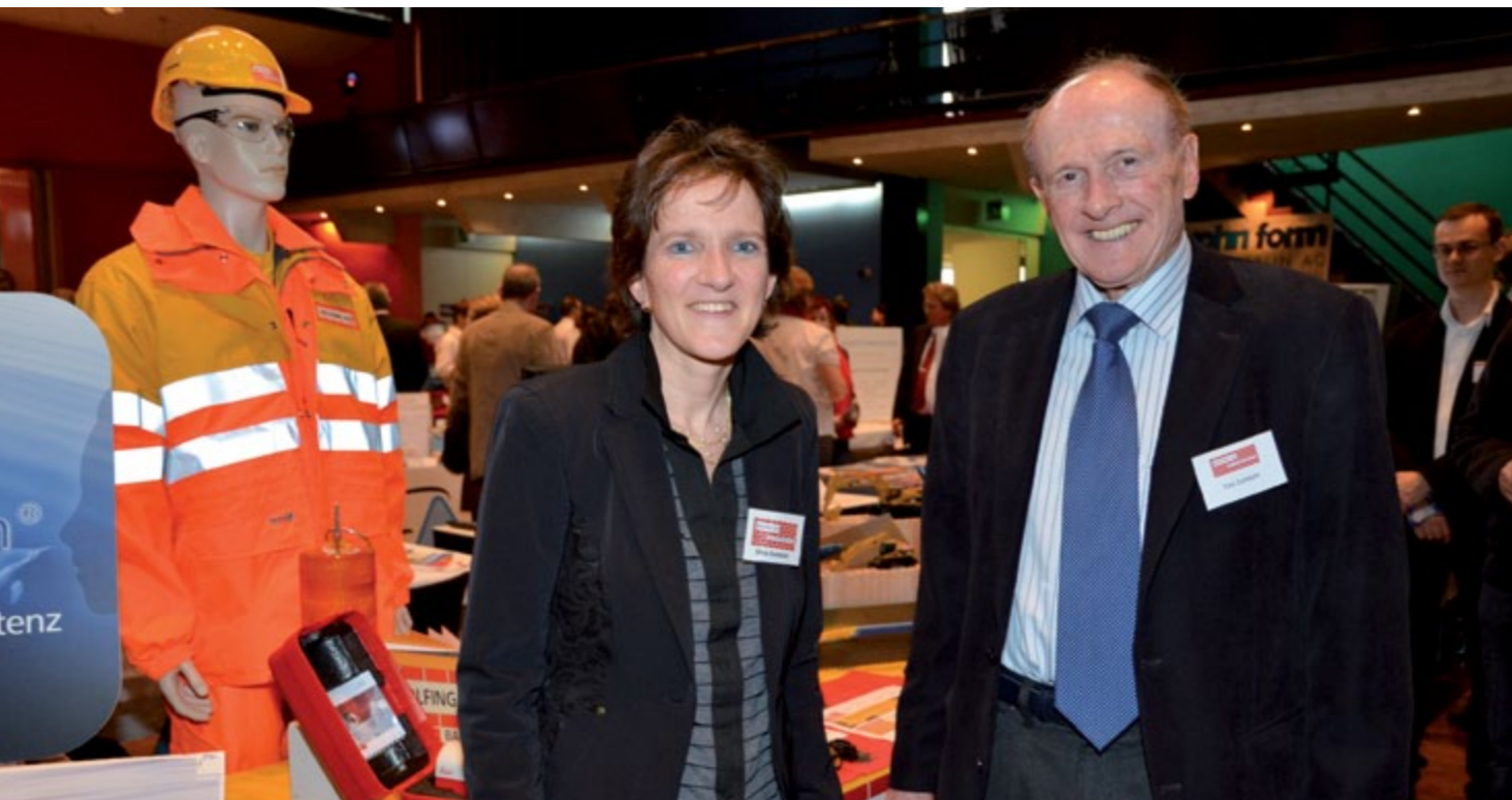
Bolfing AG, Bauunternehmung, Schwyz.