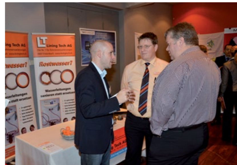
Lining Tech AG, Rohr-Innensanierungen, Freienbach.