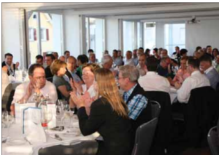
Rund 120 Mitglieder segneten alle Traktanden einstimmig ab.