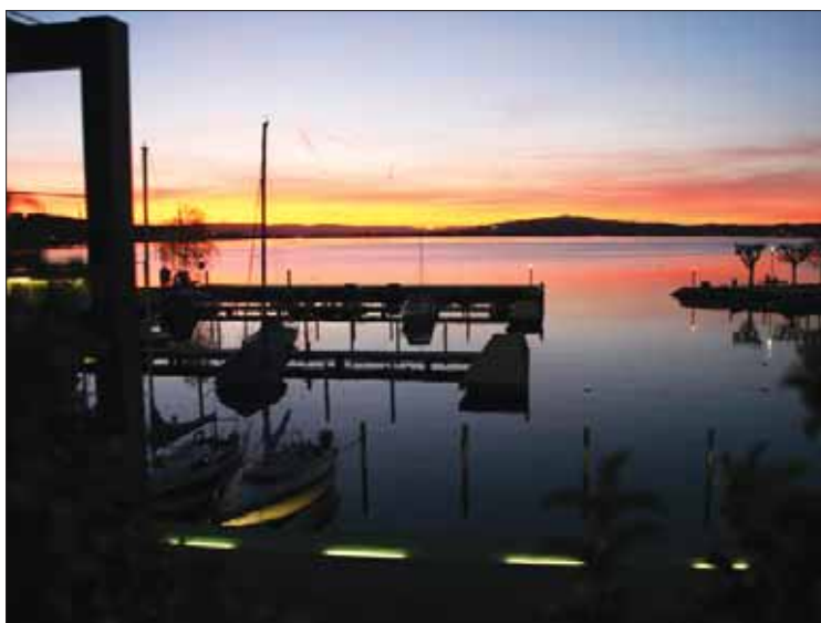
Das Ende der Generalversammlung wurde von einem spektakulären Sonnenuntergang über dem Zürichsee begleitet.